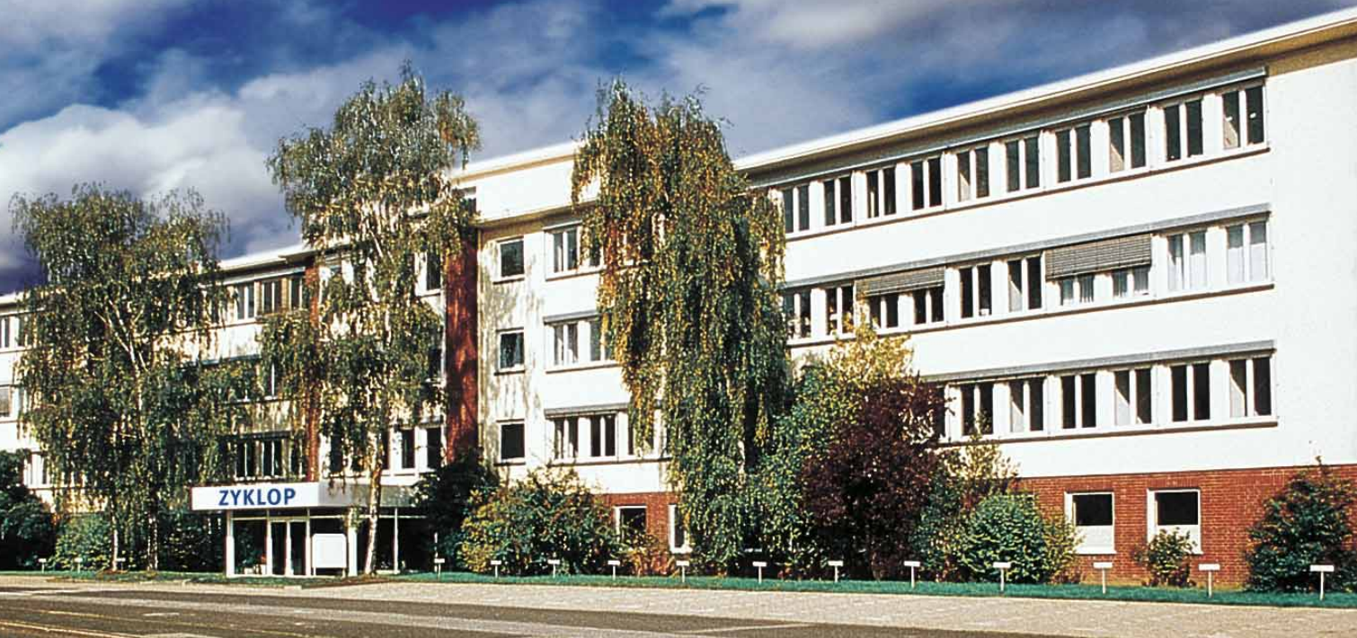
Die Zyklop-Zentrale in Krefeld, Königsberger Straße 10